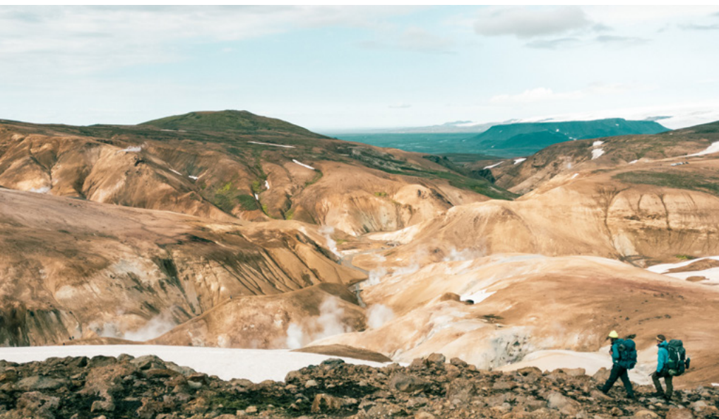
Kring de varma källorna kändes det emellanåt som att vi kommit till en helt annan planet.