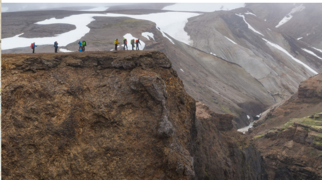
Vid branta raviner med porösa klippor höll vi oss på säkert avstånd från kanten, trots iveren att ta snygga bilder.