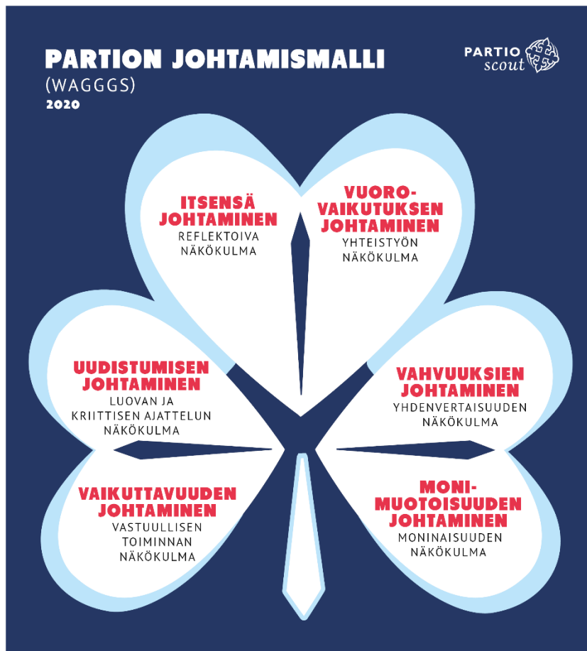
Kuva 2: Partion johtamismalli (WAGGGS)

Partio tarjoaa jäsenilleen turvallisen paikan harjoitella rohkeaa, huolehtivaa ja kunnioittavaa elämäntapaa. Henkilökohtaisten vahvuuksien kehittämiseen tarjotaan koulutusta, johtajuuden kehittämissuunnitelmia ja mielekästä tekemistä niin, että jäsenet voivat kehittää taitojaan tehden positiivisia muutoksia omassa elämässään, partiossa ja yhteisössään. Partion johtamismalli (WAGGGS) sisältää kuusi erilaista johtamisen näkökulmaa, jotka antavat näkemyksen siitä, miten itseään voi kehittää johtamisen kautta.