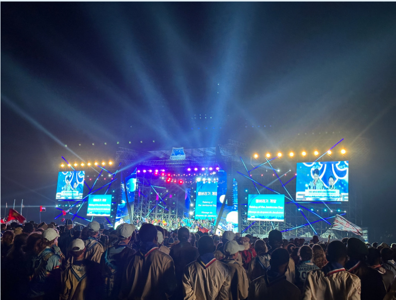
Avajais-seremonian hienot valot sekä droneshow

Leirielämä alkaa vähitellen sujua kuten partioleireillä aina muutaman päivän jälkeen. Ensimmäiset swoppaukset on tehty, kulttuuri- ja kielirajat ylittäviä kaverisuhteita solmittu ja etenkin viileä yö takasi hyvät yöunet monelle.