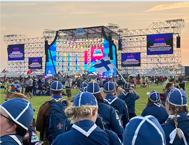
Suomen joukkue matkalla avajais-seremoniaan

Aktiviteettien lisäksi – suomalaiset saivat kehuja etenkin bussipysäkillä liekitystä ponileikistä! – leiri avattiin eilen virallisesti avajaisissa. Kolmen tunnin tapahtuman aikana kuultiin muun muassa Ban Ki-Moonia ja Antonio Guterresia Korean presidentin istuessa eturivissä, nähtiin ilotulituksia ja kuultiin K-poppia. Yleisö innostui etenkin viimeisimmästä, vaikkakin myös perinteisessä lipunkannossa hurrattiin innostuneesti oman lipun vuorolla.