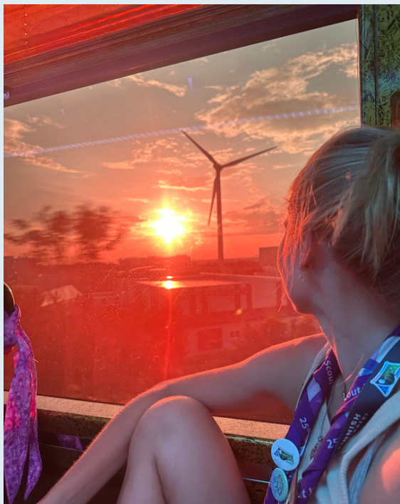
Alma ihailemassa auringonlaskua

Leiriä jatketaan Soulista käsin keskiviikkona. Leiriläisille järjestetään ohjelmaa ja tekemistä, luonnollisestikin vain hieman erilaisessa muodossa kuin leiriolosuhteissa. Kukaan tosin pistää pahakseen vaikkapa ilmastoituja museoita, päin vastoin busseissa esitettiin useampia museovierailutoiveita.