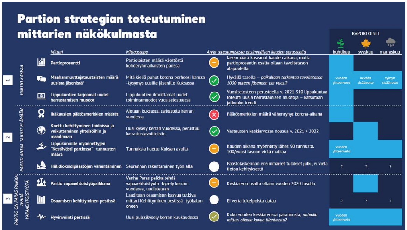
Kuva 2. Strategian mittarit ja niiden toteutuminen vuosina 2021–2022 (KUVA PÄIVITTYY)

Partion strategian kolmen päätavoitteen, partio antaa taidot elämään, partio kasvaa ja partio on paras paikka tehdä vapaaehtoistyötä, edistymistä ja tavoitteiden saavuttamista sekä strategian mittareiden saavuttamista on kuvattu lyhyesti seuraavaksi strategiakohtittain.